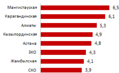
Уровень безработицы выше республиканского уровня:

В последнее десятилетие в Казахстане произошли весомые изменения в структуре занятости по видам экономической деятельности. Анализируя период с 2006 по 2016 г., следует отметить, что по некоторым видам деятельности существенно выросла занятость трудовых ресурсов, к ним в первую очередь относятся: