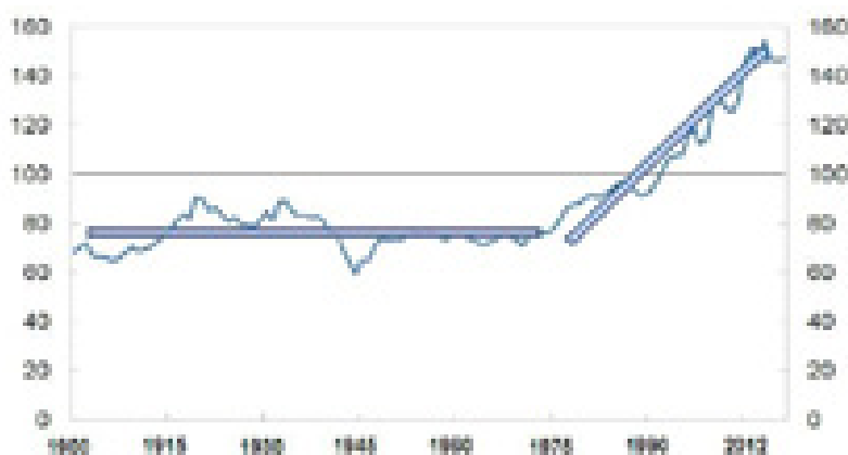
Сурет 2 – Норвегия халқының адам басына шаққандағы ЖІӨ, Швеция = 100

Норвегиядағы мұнай табыстарын басқару ісіндегі табыс деп сарапшылар осы елдегі ерекше әлеуметтік тәртіпті есептейді [16]. «Әлеуметтік келісімшарт», «келісілген ұжымдық әрекеттер» және «протестандық еңбек этикасы» санаттарын пайдалана отырып, М. Вебера, Е. Larsen Норвегияда белгіленген әлеуметтік нормалар элиталардың рентаға бағытталған әрекетіне кедергі жасайды, ал келісілген