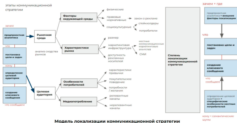
Рисунок 1 – Авторская модель локализации коммуникационной стратегии

Анализ потребителей, который включает в себя изучение их особенностей, желаний и культурного контекста (согласно Waheeduzzaman, 2004), проводится для более глубокого понимания локальной аудитории, которая имеет ключевое значение при локализации (согласно Boddewyn, 1986). Кроме того, важно изучить медиапотребление, чтобы определить эффективные каналы взаимодействия, поскольку аудитории разных стран могут реагировать на разные сообщения, рекламные активности и, в целом, деятельность компании.