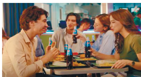
Рисунок 5 – Pepsi с фаст-фудом

Важным элементом локализации является язык коммуникации, ролик транслируется на узбекском языке, при этом используются элементы внутреннего сленга и игры слов (звуковая дорожка, слоган), что может привести к более позитивному восприятию бренда.