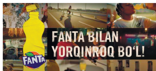
Рисунок 7 – Слоган бренда Fanta

Данные ролики демонстрируют разные степени локализации — частичную, где используется один элемент культурного кода, язык, и более сильную степень — ролик Coca Cola, где бренд органично внедрен в культурный код, однако ролик Pepsi помимо демонстрации элементов культуры использует более распространенный в Узбекистане язык коммуникации (узбекский), что говорит о полной локализации. Данная стратегия может охватить в большей степени аудитории и вызвать более сильную эмоциональную связь по сравнению с другими брендами.