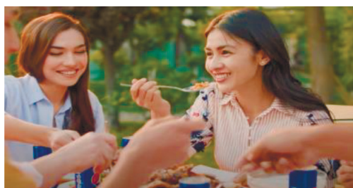
Рисунок 4 – Pepsi с национальными блюдами

В видеоролике мы видим, что бренд включает в себя как классические культурные элементы, такие как национальная кухня и традиционные праздники, так и внутренние ценности, такие как акцент на семейных ценностях и единстве жителей во время празднования праздника.