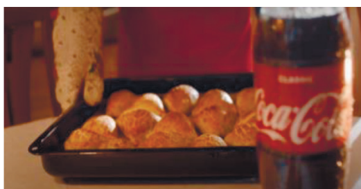
Рисунок 2 – Национальная кухни – Самса

Рекламный ролик Coca Cola. Бренд запустил коммуникационную кампанию «Отпразднуем Навруз вместе с Coca-Cola!», посвященную национальному празднику. Иностраный бренд