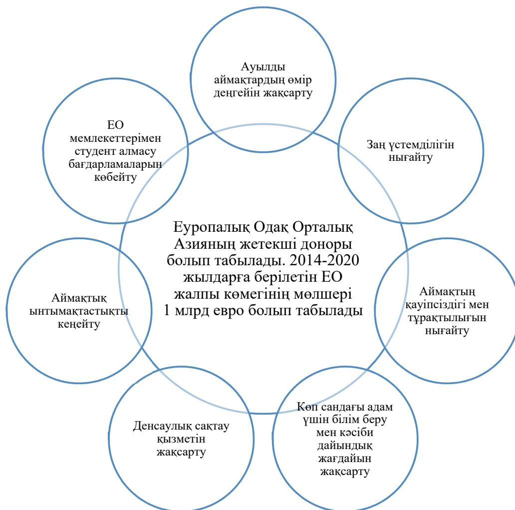
2-сурет – Еуропалық Одақ Орталық Азияның жетекші доноры

Қазақстандағы жалпы шетелдік инвестициялардың жартысынан көбі Еуропалық Одақ елдерінен келеді. 2000-2014 жылдар аралығында Еуроодақ инвестициялары шамамен 10 есе артқанын айта кету керек.